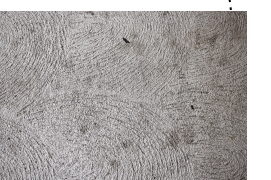
KOSTET BETONG - plasser og innganger