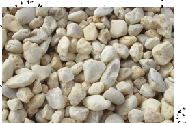
ELVEGRUS - hindrer planter rundt kirken