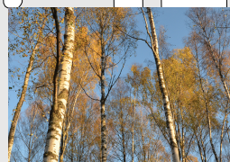
BJØRKETRÆR - i lund ved visningsrom