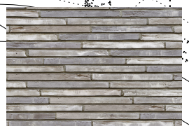
MARKTEGL - dekke for stier på gravlunden