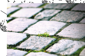
BROSTEIN - rekonstruksjon av kirkegulv