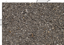
ASFALT - på nye veier og parkering