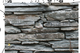
STEINMUR - rekonstruksjon av kirkemur